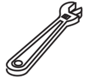
Adjustable Wrench Llave ajustable